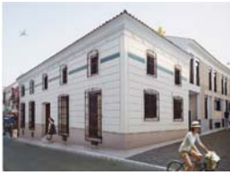
EDIFICIO FONTANA // C. MAYOR SEVILLA